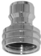
STECKTEIL mit Innengewinde