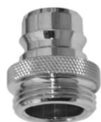
STECKTEIL mit Außengewinde