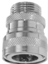
KUPPLUNGSTEIL mit Außengewinde