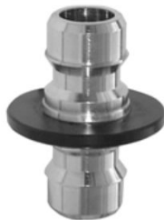
STECKTEIL zum Anschluss von 2 Schlauchkupplungen