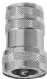
KUPPLUNGSTEIL mit Innengewinde