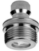
STECKTEIL mit Außengewinde und Rückflusstopp