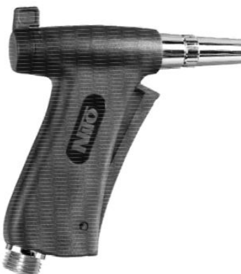
STECKTEIL mit 1/2" AG

mit Steckteil passend zu Messing- und Kunststoffkupplungsteil (z.B. Gardena)