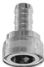
KUPPLUNGSTEIL mit Schlauchanschluß