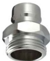
STECKTEIL mit Außengewinde