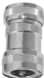
KUPPLUNGSTEIL mit Innengewinde und Wasserstop