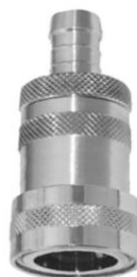
KUPPLUNGSTEIL mit Außenengewinde und Wasserstop