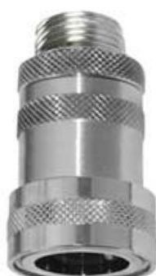
KUPPLUNGSTEIL mit Außengewinde und Wasserstop