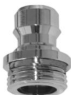
STECKTEIL mit Außengewinde