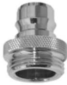
STECKTEIL mit Außengewinde