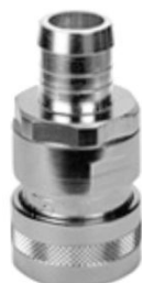
KUPPLUNGSTEIL mit Schlauchanschluß und Wasserstop