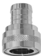
KUPPLUNGSTEIL mit Schlauchanschluß