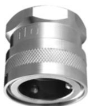
KUPPLUNGSTEIL mit Innengewinde