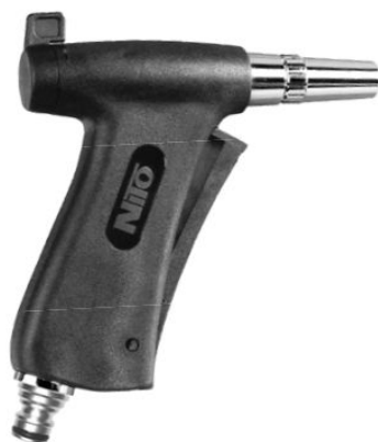
STECKTEIL passend für Messing-u. Kunststoffkupplungen (z.B. Gardena)

mit Steckteil passend zu NITO Kupplungen Serie 5300 und 5400