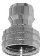
STECKTEIL mit Innengewinde