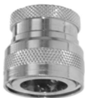
KUPPLUNGSTEIL mit Innengewinde