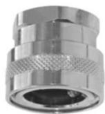
KUPPLUNGSTEIL mit Innengewinde