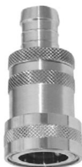
KUPPLUNGSTEIL mit Schlauchanschluß