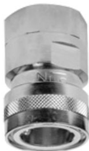
KUPPLUNGSTEIL mit Innengewinde und Wasserstop