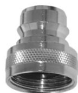
STECKTEIL mit Innengewinde