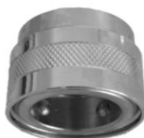
KUPPLUNGSTEIL mit Verschluss